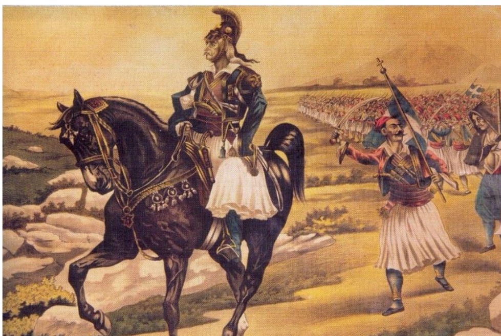
Εικόνα 3: Νέστωρ Λ. Βαρβέρης, 1908 «Ο Κολοκοτρώνης κατευθυνόμενος προς τη Νεμέα» (ο πίνακας βρίσκεται στο Μουσείο της Κορίνθου)

μέχρι την πόλη της Πάτρας και κλείστηκαν στο κάστρο, εφόσον όπως αναφέρεται ορθά, « τοιουτοτρόπως μετέβαλεν ο Κολοκοτρώνης την κατά την 9 Μαρτίου ήτταν των Ελλήνων εις νίκην ». Όσον αφορά στις απώλειες, ο Γέρος του Μοριά αναφέρει στα απομνημονεύματά του πως « επήραμε κεφάλια διακόσια πενήντα. Τι όμως έγιναν οι λαβωμένοι δεν ηξεύρω », ενώ από τους Έλληνες φονεύτηκαν ή τραυματίστηκαν περί τους είκοσι. Παρά την ήττα τους όμως οι Τούρκοι, στην προσπάθειά τους να λύσουν την στενή πολιορκία, επιτέθηκαν και πάλι εναντίον του Γηροκομείου και των ελληνικών θέσεων στο Σαραβάλι περί το τέλος Μαρτίου, αλλά κατανικήθηκαν και οπισθοχώρησαν χάρη στην ανδρεία που επέδειξαν οι ελληνικές δυνάμεις υπό τον Πλαπούτα, τον οποίο αναχωρώντας ο Κολοκοτρώνης για την Κόρινθο μετά την πρώτη μάχη, είχε αφήσει « τοποτηρητήν ..., εις ον ανέθετε πάντοτε τα της στρατοπεδαρχίας ».